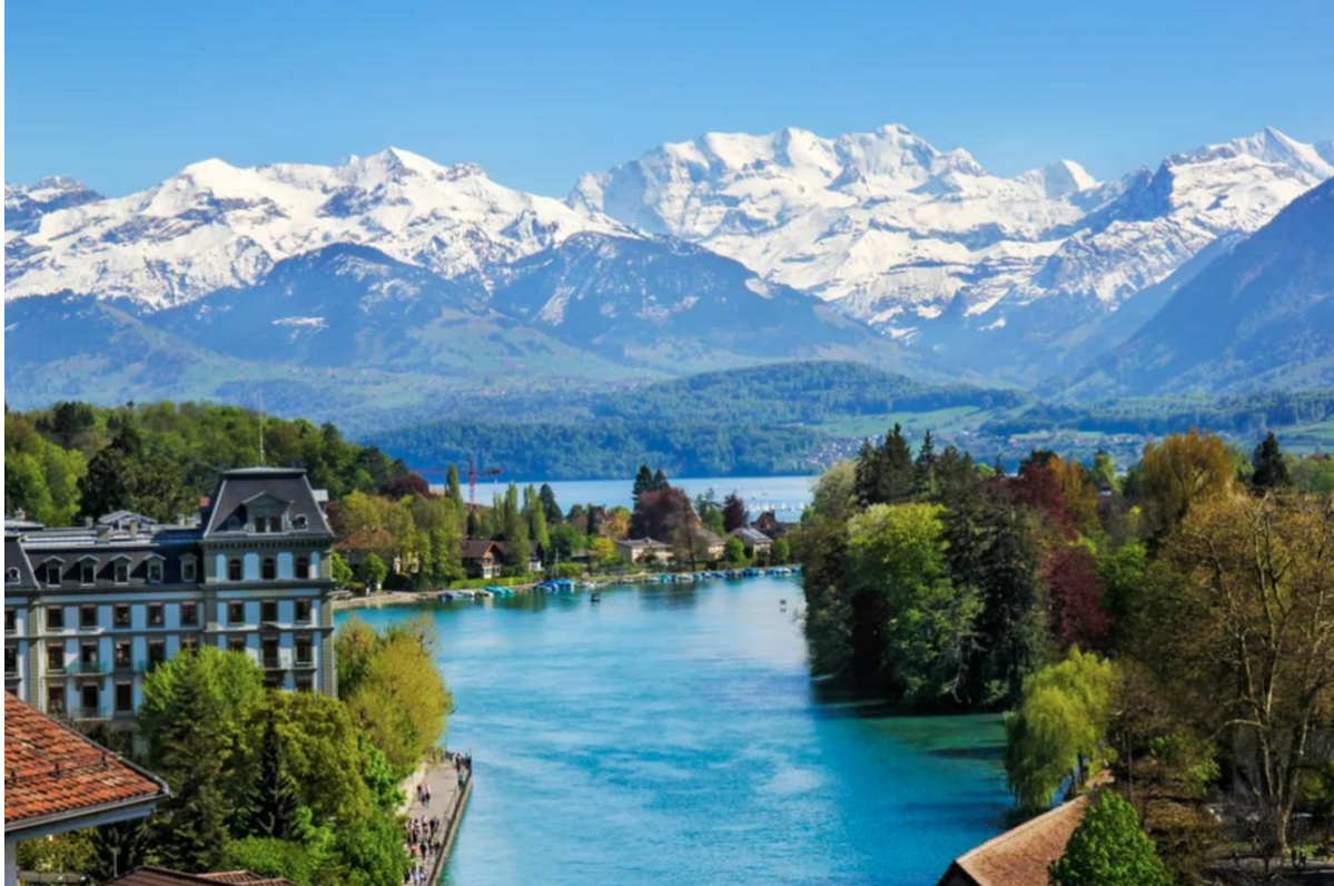
Lacul Thun cu vârfuri de 4000 de metri în fundal

Dacă sunteți interesat(ă), vă rugăm să trimiteți o scurtă scrisoare de motivație (o pagină) împreună cu CV-ul dumneavoastră la adresa info@religiushypotheses.com până la data de 31 ianuarie 2023 .